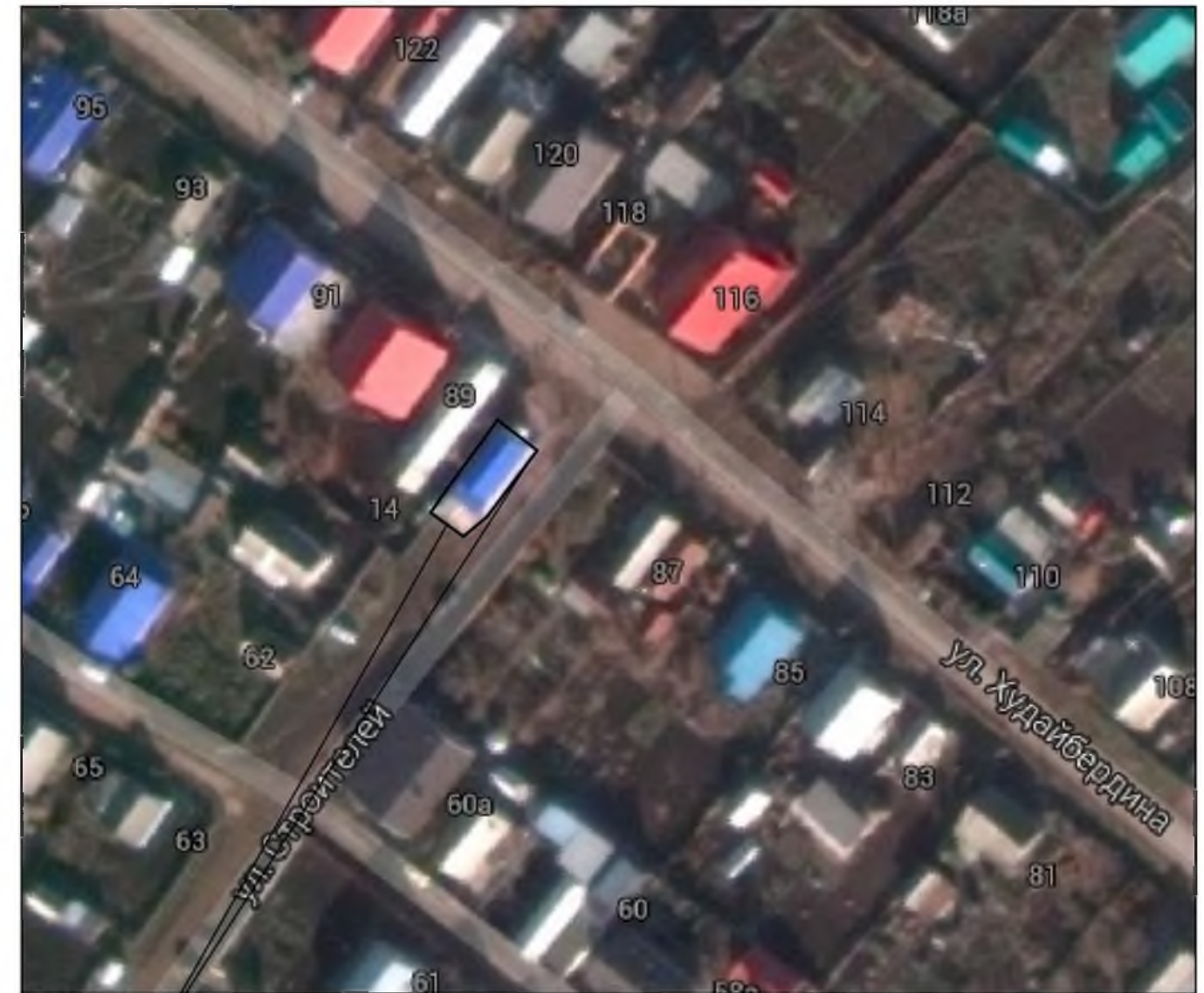
СХЕМА РАСПОЛОЖЕНИЯ ПРОЕКТИРУЕМОЙ ТЕРРИТОРИИ НА КАДАСТРОВОЙ КАРТЕ СИТУАЦИОННЫЙ ПЛАН