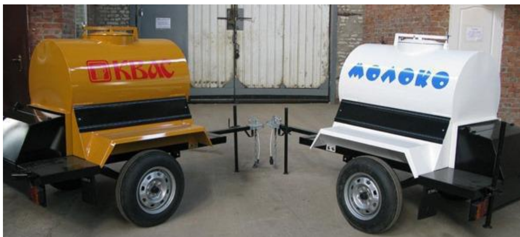
Кеги для кваса

Автоприцеп - цистерна для реализации пищевых жидкостей предназначена для перевозки и реализации в розлив жидких пищевых продуктов (кваса, молока ит.д.). Описание: цистерна выполнена на одноосном шасси с рессорной подвеской для буксировки автомобилем, оборудованном сцепкой. Теплоизоляция не допускает изменения температуры жидкости более чем на 2..3° С в течение 8 часов при разности температур жидкости и окружающей среды 25..30°С. Дополнительно может оснащаться холодильной установкой, работающей от сети 220 В только во время стоянки. Внутренняя емкость изготовлена из пищевой нержавеющей стали, внешняя обшивка - окрашенный стальной лист. Мойка и санитарная обработка емкости производится через горловину, которая закрывается термоизолированной крышкой с дыхательным клапаном.