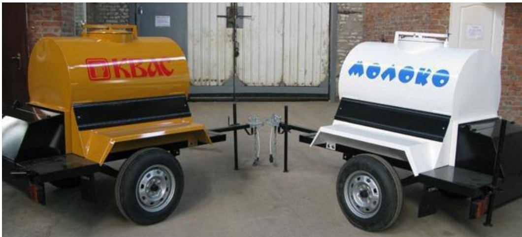
Кеги для кваса